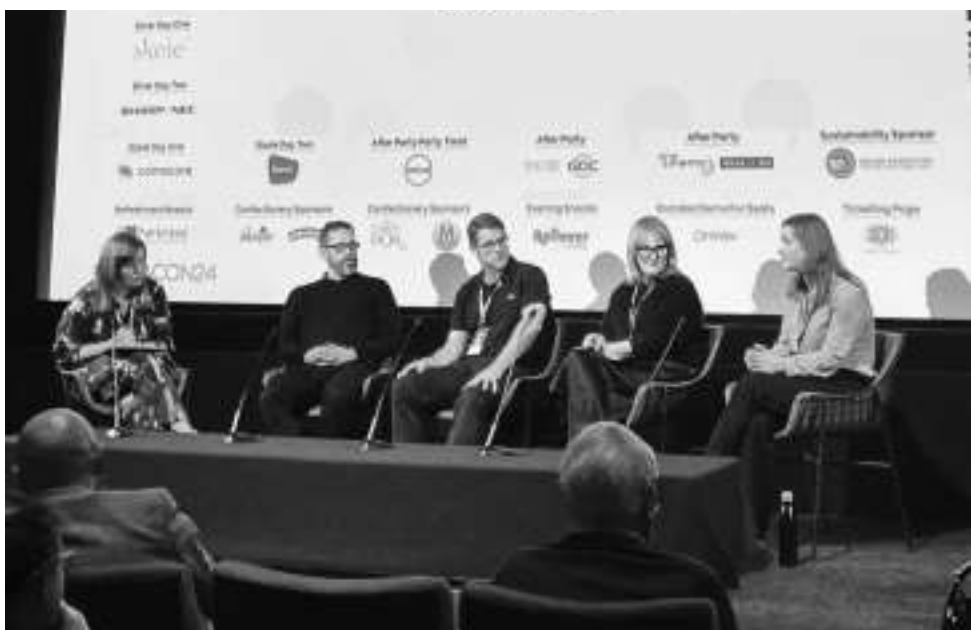
英国影院协会年度会议

活动影片的购票模式也在发生变化。从历史上看,活动影片的上映准备时间比传统故事片的更长,但观众越来越多地在临近上映日期时购票,而不是提前那么长时间预订票了。